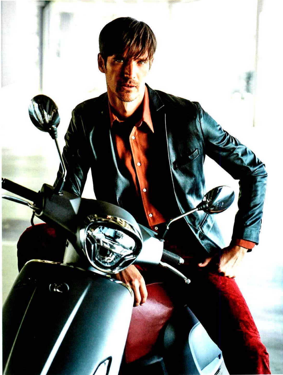
Camisa de Pedro del Hierro , blazer de Karl Lagerfeld , pantalón de X-Adnan y Scooter Like 125 , de Kymco .